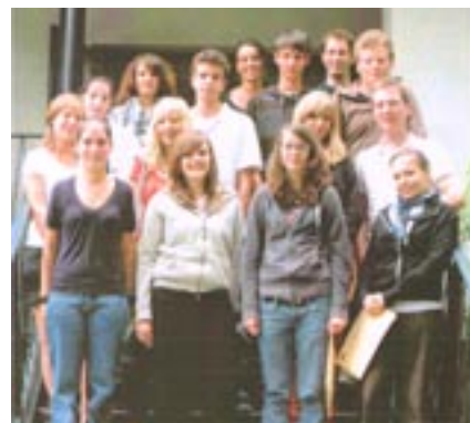
Der deutsch-französische Jugendaustausch von Ichenhausen in Changé vom 23.08. – 31.08.2008