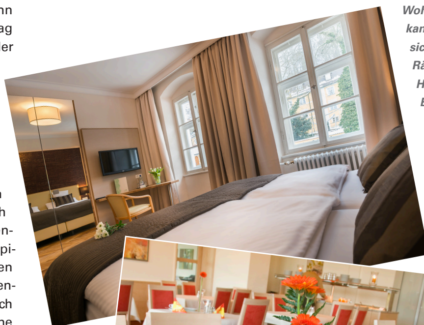
Wohlfühlen kann man sich in den Räumen des Heilbads.