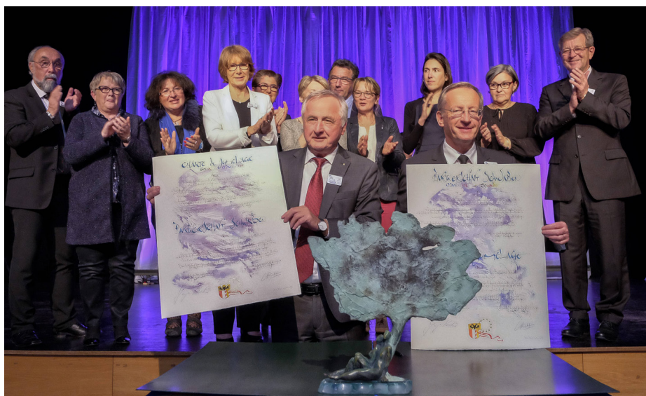
Die Präsidenten der beiden Regionen mit den neu unterschriebenen Partnerschaftsurkunden vor dem Baum der Erinnerungen.