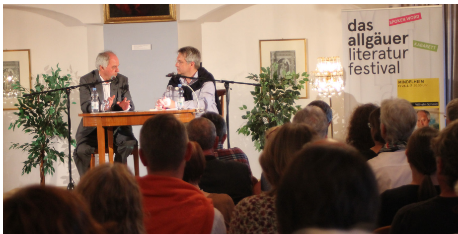
Lesung von Wilhelm Schmid im Silvestersaal in Mindelheim.