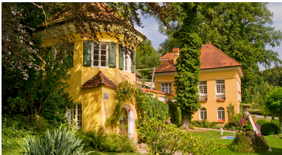
Das Heilbad in Krumbach.

Neben der Anerkennung als Sanatorium ist das Heilbad Krumbach aufgrund des natürlichen Heilmittelvorkommens des kieselsäurehaltigen „Krumbader Badstein“ als Peloidkurbetrieb (griechisch pelos: Schlamm) staatlich anerkannt. Hauptbestandteil des „Badsteins“ ist Kieselsäure. Der Stein wird nahe des Krumbads in 3 bis 5 m