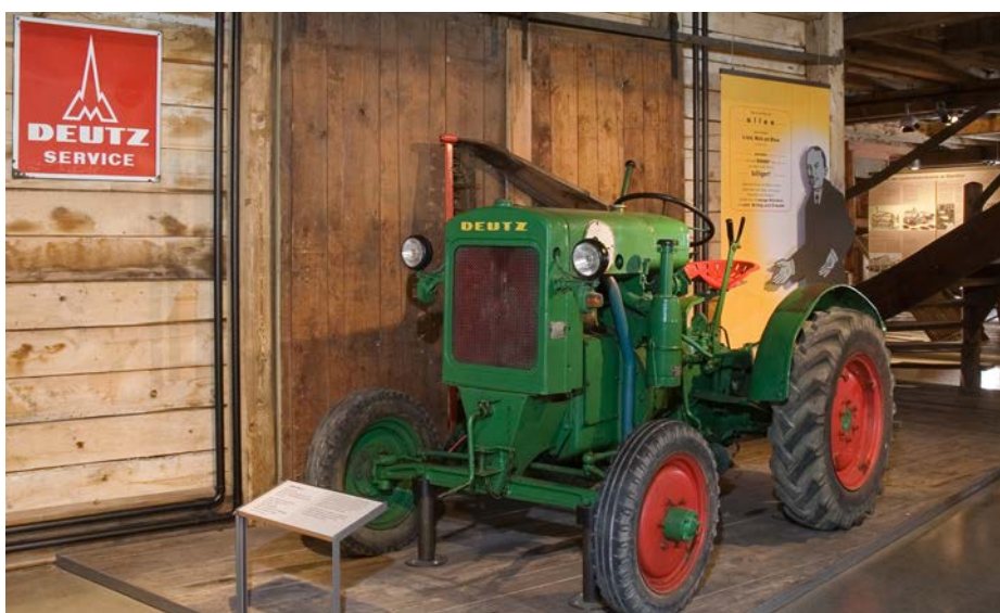
Ein Traktor der Firma 'Deutz Service' aus der Ausstellung Landtechnik im Bauernhofmuseum.

Und genau dieses nachhaltige und bedarfsgerechte Wirtschaften, das heutzutage wieder ins Bewusstsein gerückt ist, möchte ich anhand der Technikexponate in den Vordergrund stellen. Doch lassen Sie mich noch einmal