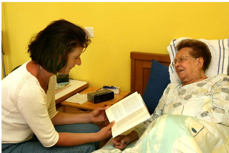
Kompetenz in einer Hand: Auch die ambulante Hilfe zur Pflege liegt nun in der Zuständigkeit des Bezirks.

Insgesamt rechnet man beim Bezirk mit Mehrausgaben von rund 10 Millionen Euro durch die ambulante Hilfe zur Pflege, Geld, das zuvor von den