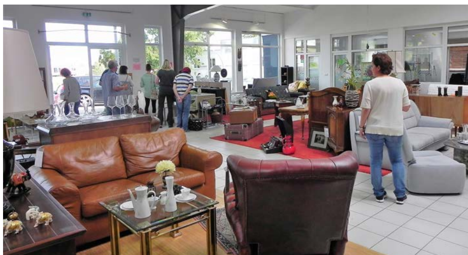
Oben: Gebraucht heißt Vintage Chic im KaufHOIs. Unten: Hier findet jeder was –egal ob kleiner oder großer Geldbeutel.