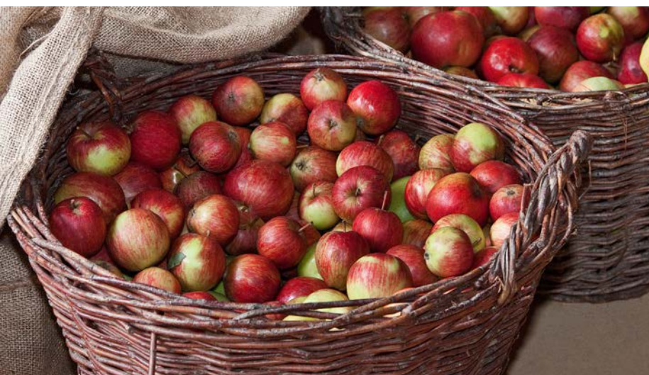
Bei den Obsttagen im Bauernhofmuseum können sich Besucher über alte Sorten informieren.