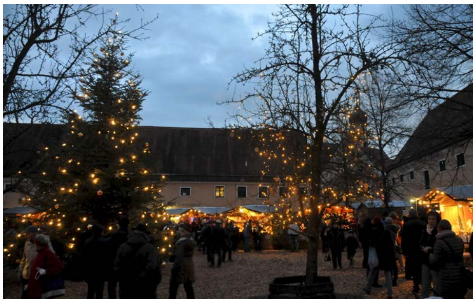
Vorweihnachtliche Atmosphäre auf dem Oberschönenfelder Weihnachtsmarkt.

„Alle Jahre wieder“ weckt das schöne Angebot der Kunsthandwerker vom Ries bis ins Allgäu die Vorfreude auf das Weihnachtsfest und beschert großen und kleinen Besuchern leuchtende Augen. Neben Vorführungen ihres Könnens bieten die Handwerker traditi-