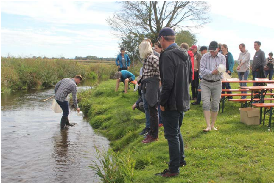
Unterrichtsstunde im Freien.

Eine Art Weiterbildung für ganz besondere Multiplikatoren wurde nun am Schwäbischen Fischereihof in Salgen durchgeführt: In der Einrichtung des Bezirks Schwaben fand die „Fachbetreuertagung Biologie“ statt, die von 58 Gymnasiallehrern aus dem ganzen Regierungsbezirk besucht wurde.