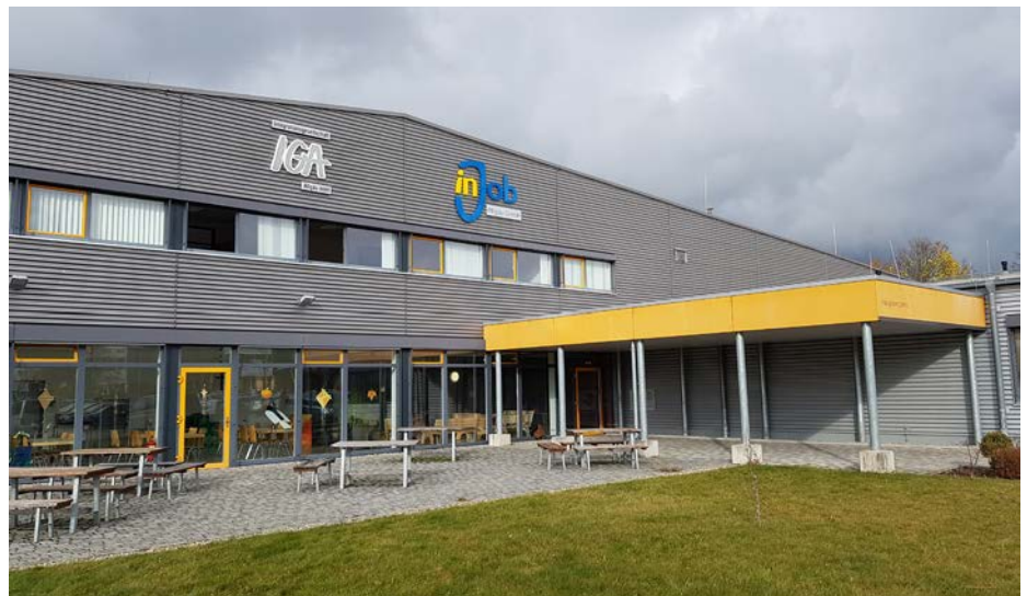
Unter einem Dach: IGA und „InJob“