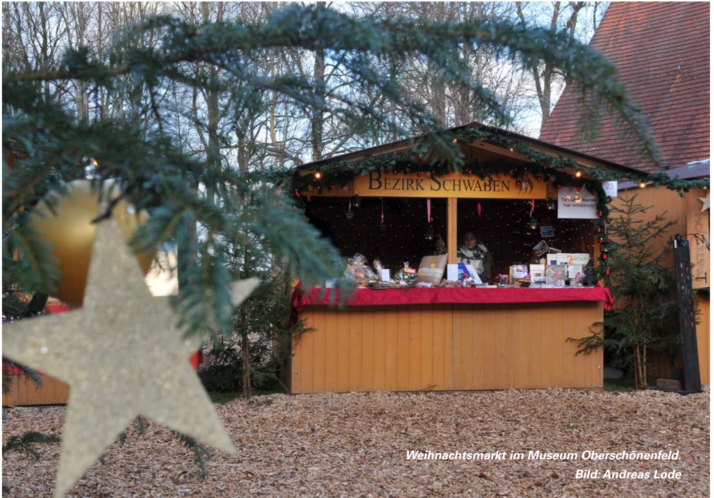
Weihnachtsmarkt im Museum Oberschönenfeld.